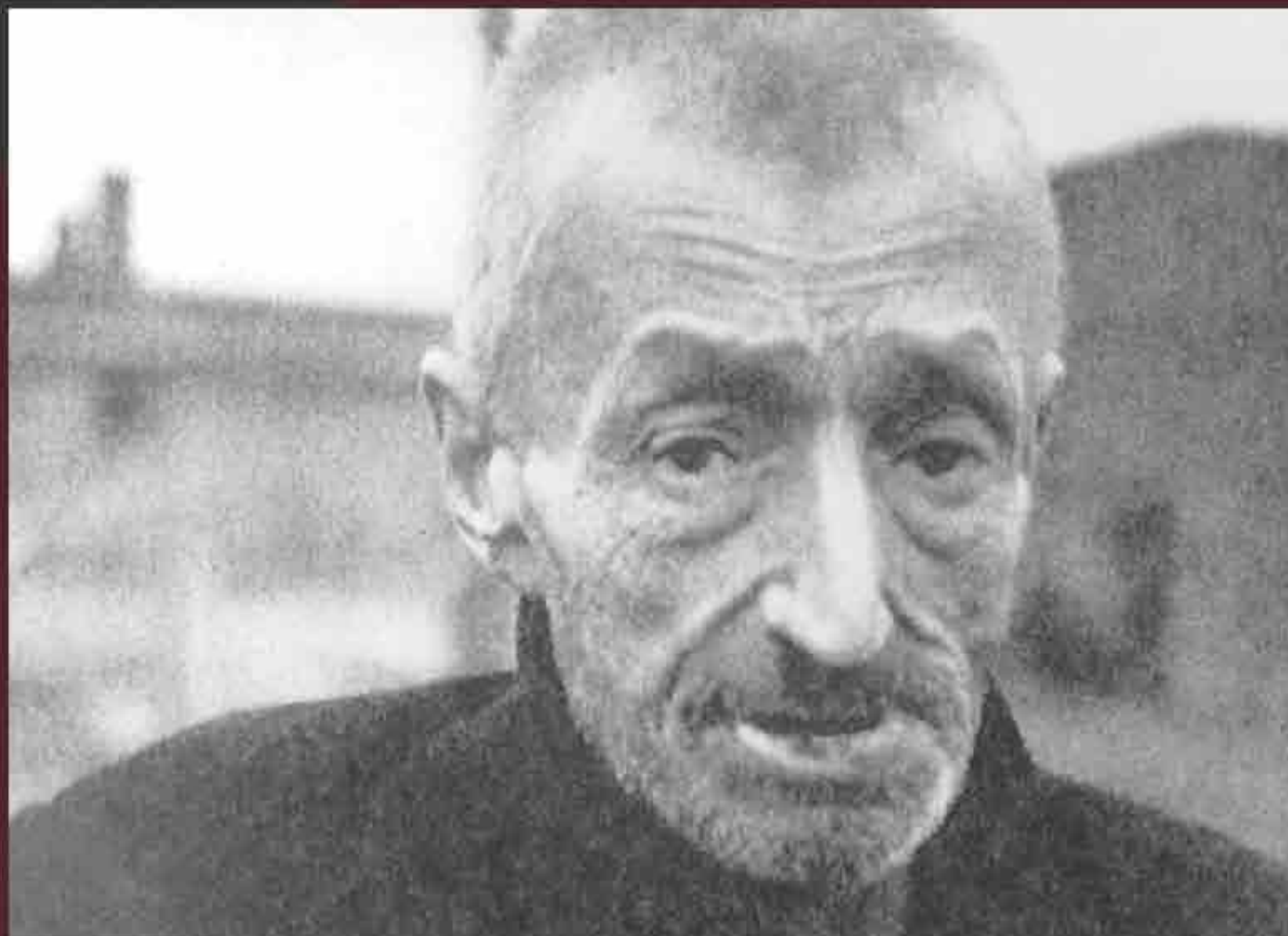
A forty-year-old inmate at liberation in late January 1945.

Despite valiant medical efforts, many camp inmates died after liberation. Those who survived had to deal with both the psychological and physical legacy of their imprisonment in the camps.