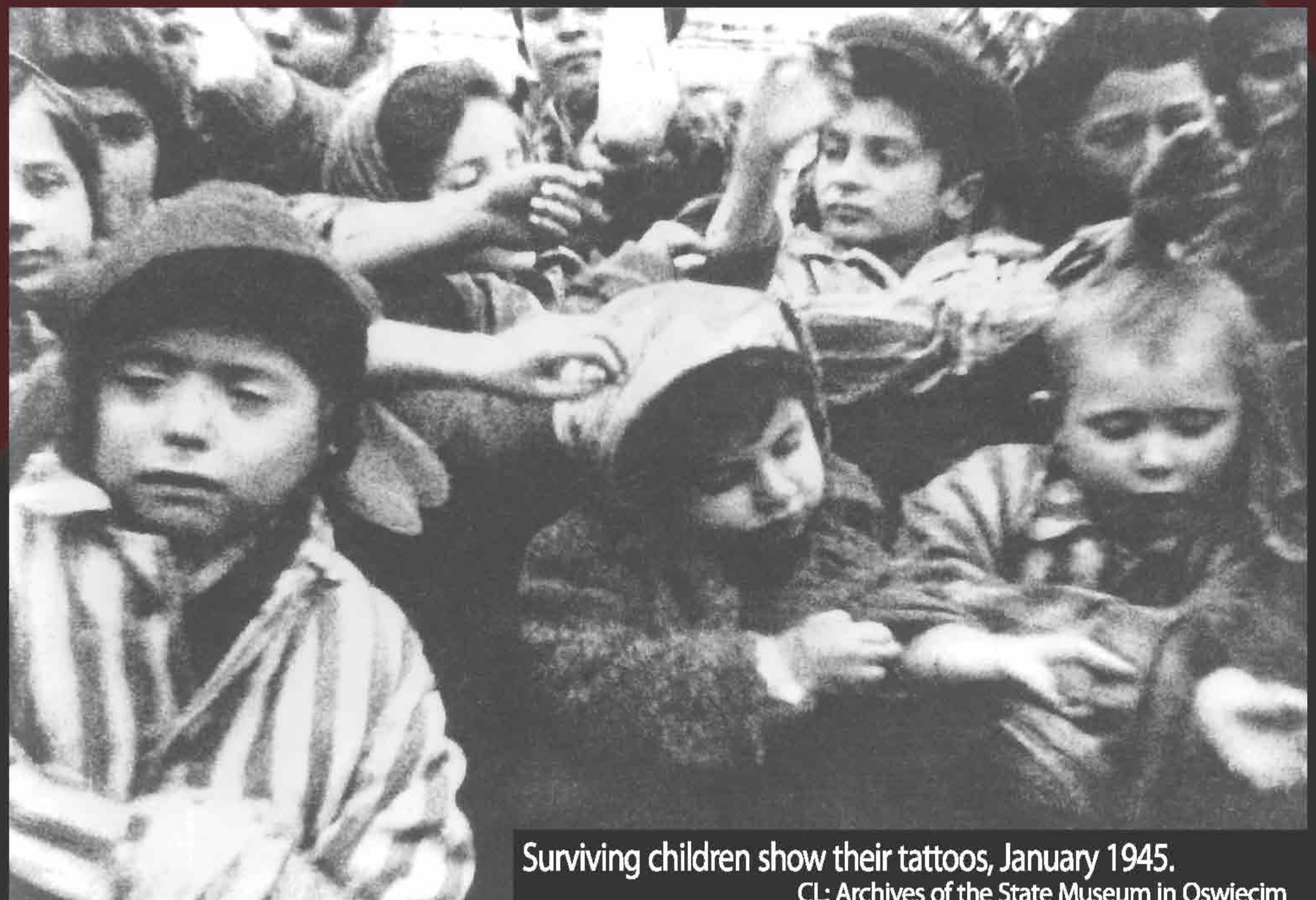
Surviving children show their tattoos, January 1945.

"หากเยอรมันจะต้องถูกทำลาย ศัตรูและอาชญากรในค่ายกักกันของเราก็จะไม่มีวันได้ไพล่พ้นออกจากซากปรักหักพังของเราอย่างผู้ชนะได้ พวกมันจะต้องถูกทำลายไปด้วยนี้คือคำสั่งโดยตรงของท่านผู้นำและข้าพเจ้าจะจัดการให้เป็นไปตามนั้นโดยละเอียดถึงขั้นสุดท้าย" ไฮน์นิช ฮิมม์เลอร์ (Heinrich Himmler) พ.ศ. 2488