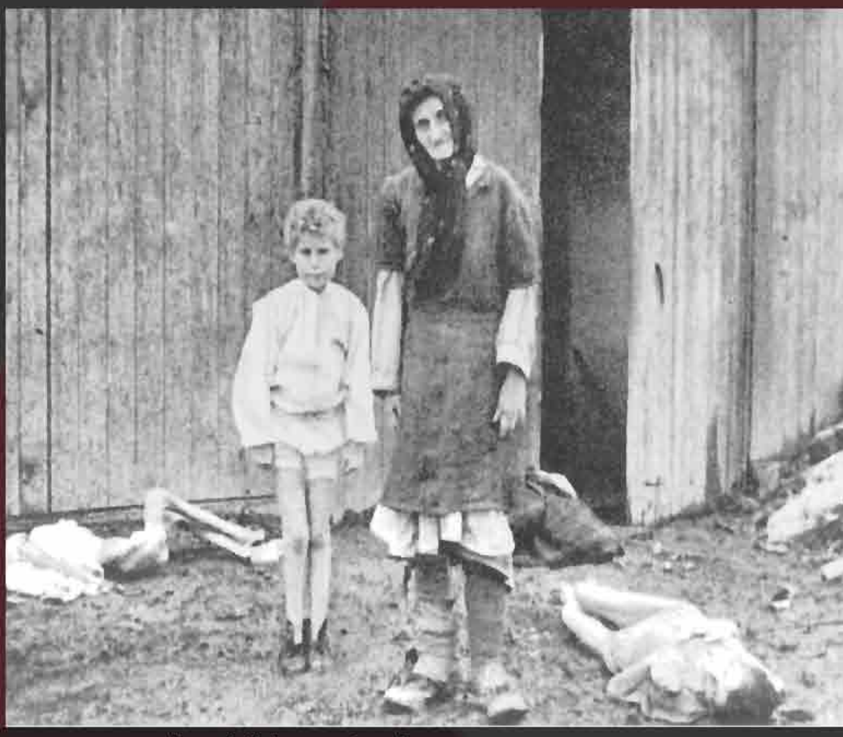
A woman and a child survived.

"If National Socialist Germany is going to be destroyed, then her enemies and the criminals in concentration camps shall not have the satisfaction of emerging from our ruin as triumphant conquerors. They shall share in the downfall. Those are the Führer's direct orders and I must see to it that they are carried out down to the last detail."