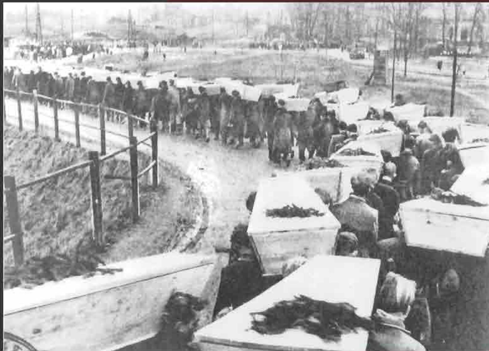
Mass burials in liberated Auschwitz by the Soviet Army in January 1945.

Despite valiant medical efforts, many camp inmates died after liberation. Those who survived had to deal with both the psychological and physical legacy of their imprisonment in the camps.